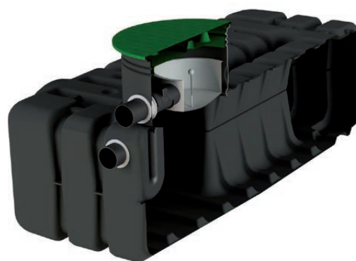
AT 70 2500 + kit pluviales FT